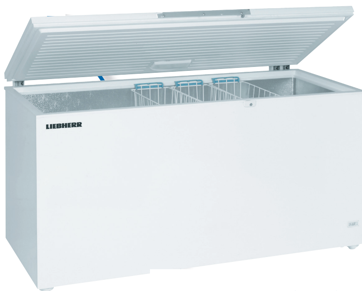
GTL 6105 X